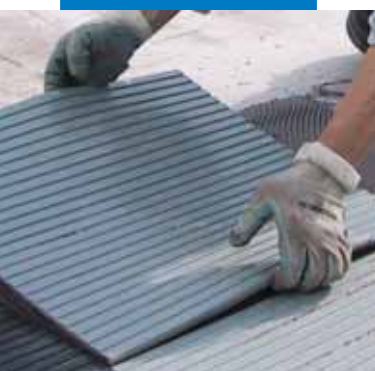
Укладка резиновой плитки с профилированной тыльной стороной с помощью клея Granirapid

древесные агломераты, асбестоцемент и пр.);