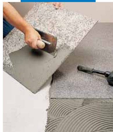
Укладка эластичного синтетического гранита с помощью серого Granirapid