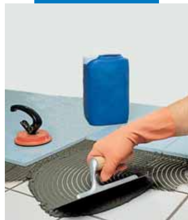
Укладка агломерата поверх имевшейся керамической плитки с использованием серого Granirapid