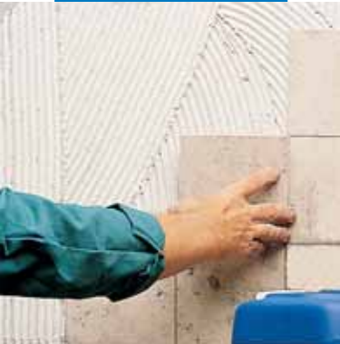
Укладка юрского мрамора с помощью белого Granirapid