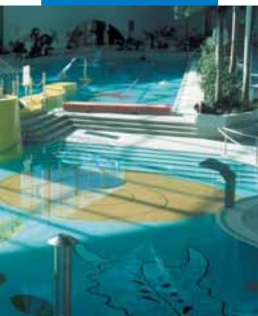
Пример укладки мозаики и клинкерной плитки в бассейне

Содержащиеся в данном руководстве указания и рекомендации отражают всю глубину нашего опыта по работе с данным материалом, но при этом их следует рассматривать лишь как общие указания, подлежащие уточнению на практическом опыте. Поэтому, прежде чем широко применять материал для определенной цели, следует проверить его на адекватность, предусмотренному виду употребления, принимая на себя всю полноту ответственности за последствия, связанные с применением данного материала.