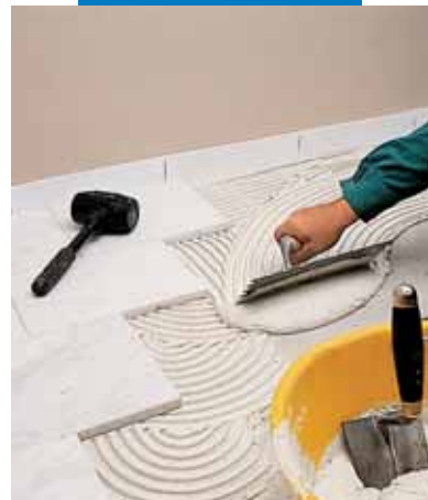
Укладка белого каррарского мрамора с помощью серого Granirapid