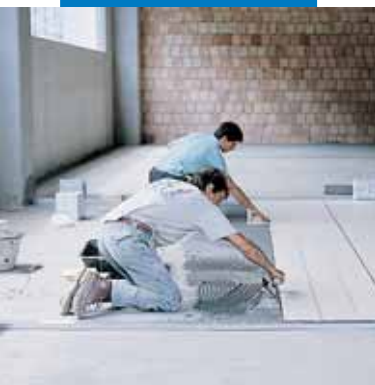
Укладка фарфоровой неглазурованной плитки в промышленных помещениях