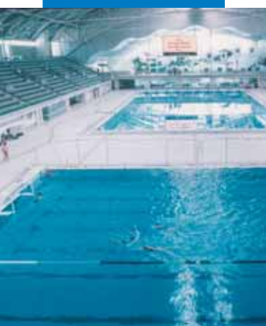
Пример укладки мозаики и клинкерной плитки в бассейне - Олимпийский центр в Сиднее (Австралия)

Любое воспроизведение или перепечатка части или целых текстов, фотографий или иллюстраций, опубликованных здесь, не разрешается и преследуется в соответствии с действующими законодательствами.